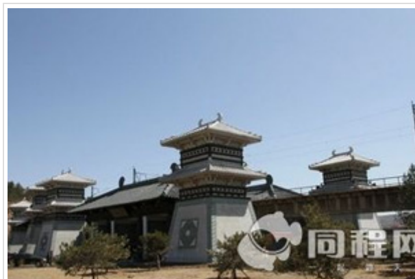
五台山-平遥古城-乔家大院 5 日游