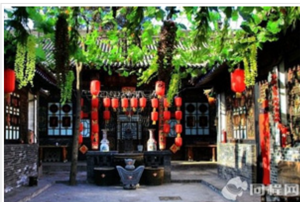
体验古城文化 3 日游 平遥 煤博 晋祠