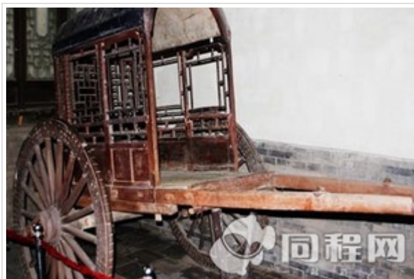
平遥-常家庄园-王家大院 3 日游