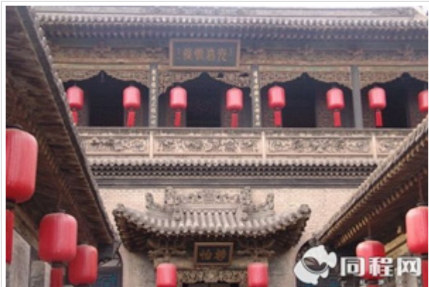
晋祠-平遥古城-乔家大院 2 日游