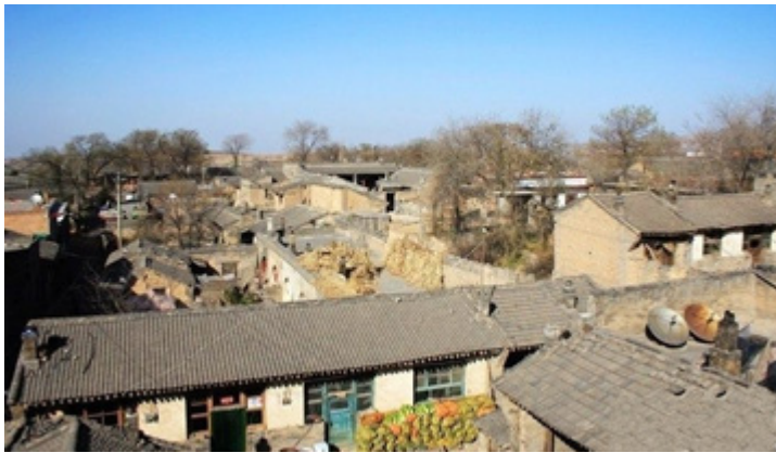
张壁村全貌

张壁古堡位于山西省介休市龙凤镇张壁村，是我国现有比较完好的一座融军事、居住、生产、宗教活动为一体的，罕见的古代袖珍“城堡”，它集中了夏商古文化遗址、隋唐地道、金代墓葬、元代戏台、明清民居等许多文物古迹，特别是隋唐地道、刘武周庙、琉璃碑等为全国罕见，张壁独有。