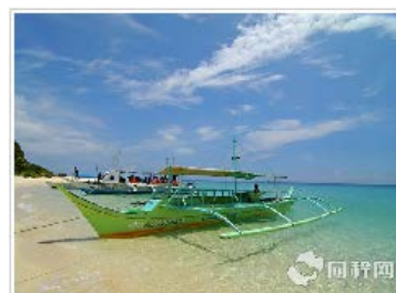
长滩岛-香港 4 晚 5 日