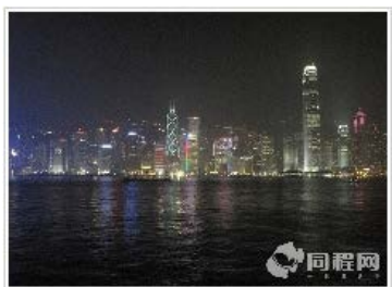
【暑假】香港 4 日品质游