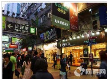
北京出发 港澳五日