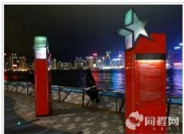
苏州出发 香港 4 日游