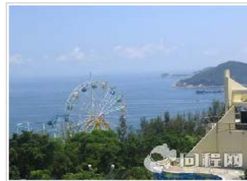
北京出发 香港 4 日游