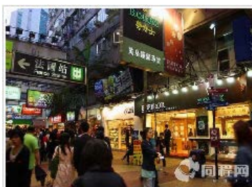
【暑假】香港-澳门 5 日