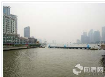
游东方明珠 外滩 城隍庙