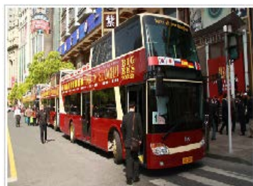
上海 big bus 巴士自助游