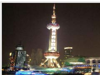
上海城市观光 1 日游