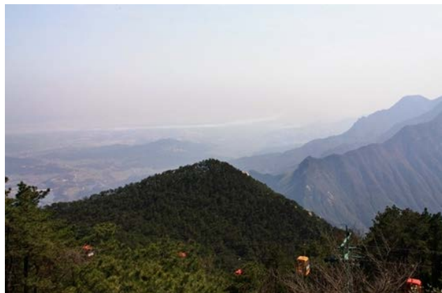
（本图片由一起游网友@赛螃蟹 提供）

含鄱口海拔 1286 米，含鄱岭和对面的汉阳峰之间形成一个巨大壑口，大有一口汲尽山麓的鄱阳湖水之势，故得名。