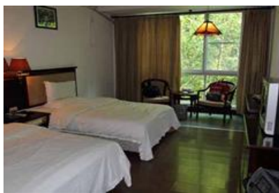
清远第一峰温泉酒店