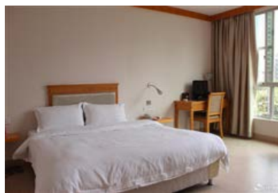
清远运通泰商务酒店