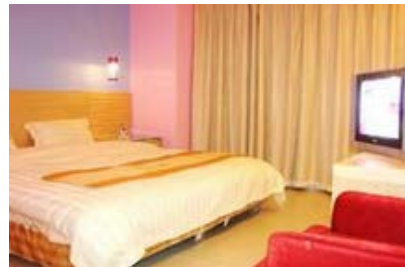
莆田湄洲岛台湾度假山庄