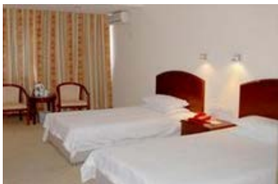
莆田湄洲美海大酒店