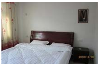
永定土楼承启楼( 农家饭庄 )

在永定，下洋是个住宿不错的选择，因为每个宾馆都有天然的温泉，下洋有个流行语“观下洋初溪土楼群，吃下洋小吃，浴下洋天然温泉”。