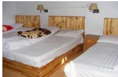
永定土楼福裕楼常棣客栈