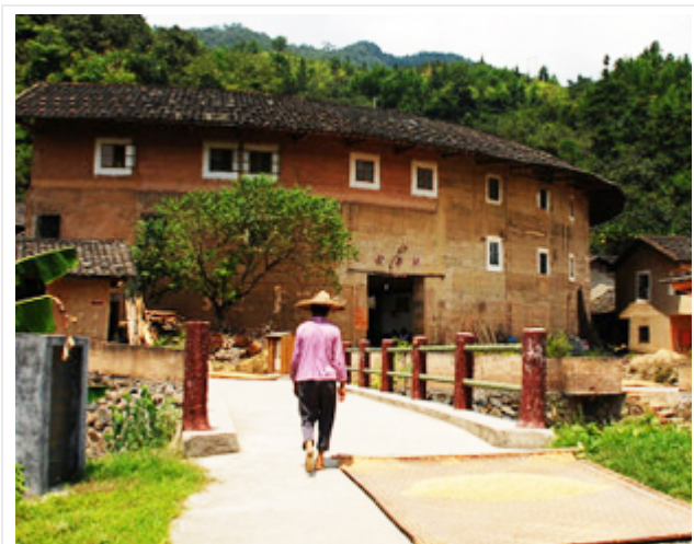
(朝阳楼：图片由一起游友@瞎白话提供)

朝阳楼为 U 字形土楼，又称为半月楼，林氏民居，建于 1968 年，坐北朝南，占约 4000 平方米。高 3 层，28 开间，中为天井，南面有 10 开间已毁。一、二层不开窗，内通廊式平面。全楼有 2 道楼梯，一口水井。一层后厅为祖堂。悬山顶，抬梁，穿斗混合式构架。