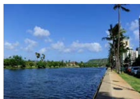
美国行之夏威夷街景 作者：美鱼儿