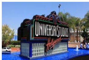
美国自驾游 23 作者：草净沙