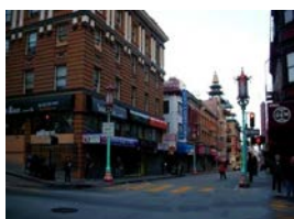
2010 美国狂野行