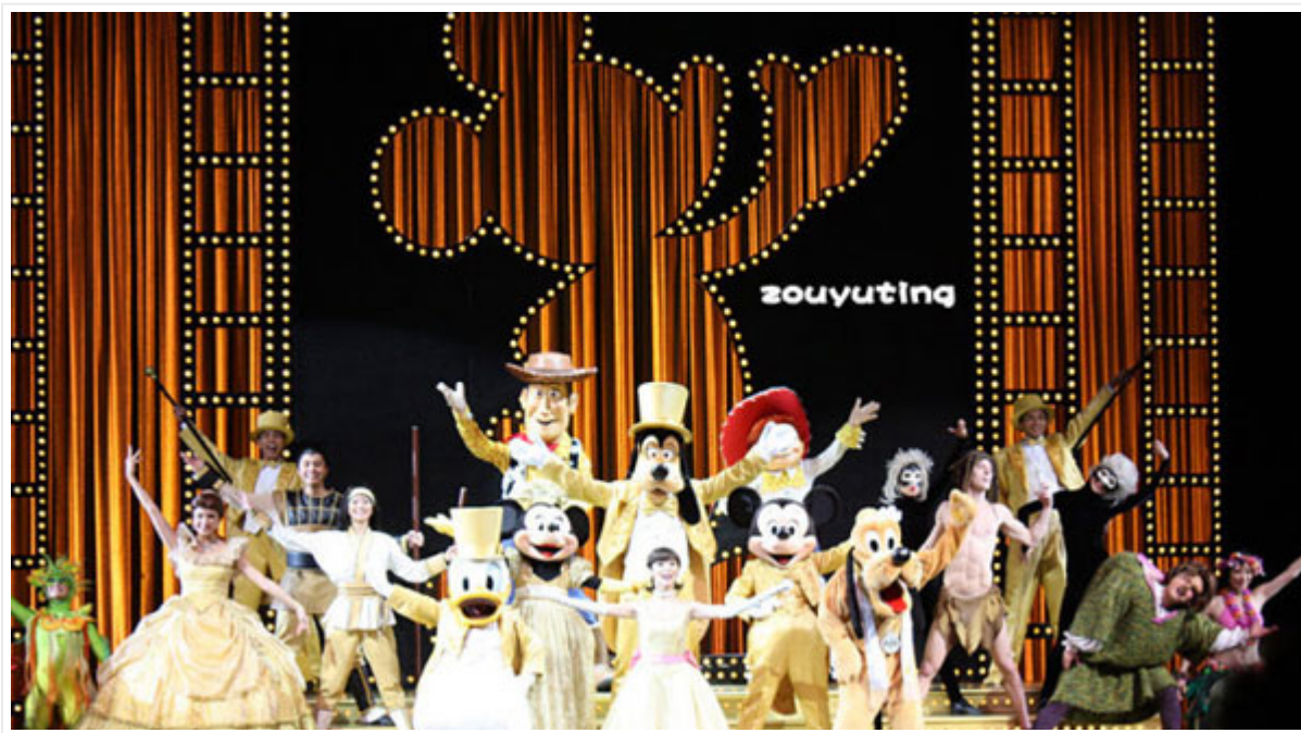
（图片由一起游网友@雨婷 1987 提供）

米奇金奖音乐剧： 音乐剧以颁奖礼形式表扬迪士尼最受欢迎的电影、歌曲和人物，大家来看各个奖项花落谁家。精彩的歌声舞影，标志着好来坞的璀璨光芒，与您重温迪士尼经典动画电影，当中包括「花木兰」、迪士尼/Pixar 的「玩具总动员」及「扮嘢小魔星」。