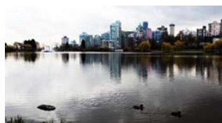
北美掠影-温哥华斯坦利公园 作者：散人观沧海