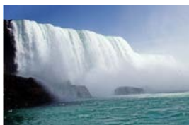
雾中少女瀑布游 作者：莹竹