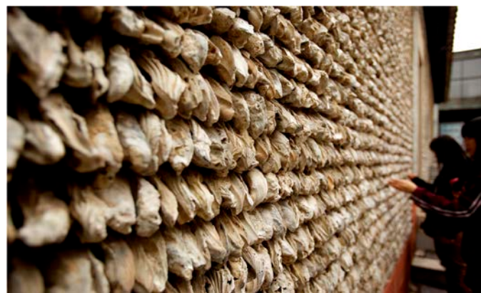
( 蚝壳墙 )

镬耳墙又名锅耳墙，因其形状与菜锅的手柄相似得名。在元明清时代，只有拥有功名的人才有此资格建造，官位大小决定锅耳的高低。民间还有一种传说：修锅耳墙可以保佑子孙当官，蕴涵富贵吉祥丰衣足食。锅耳墙后又称为“鳌头墙”，有“独占鳌头”的寓意。