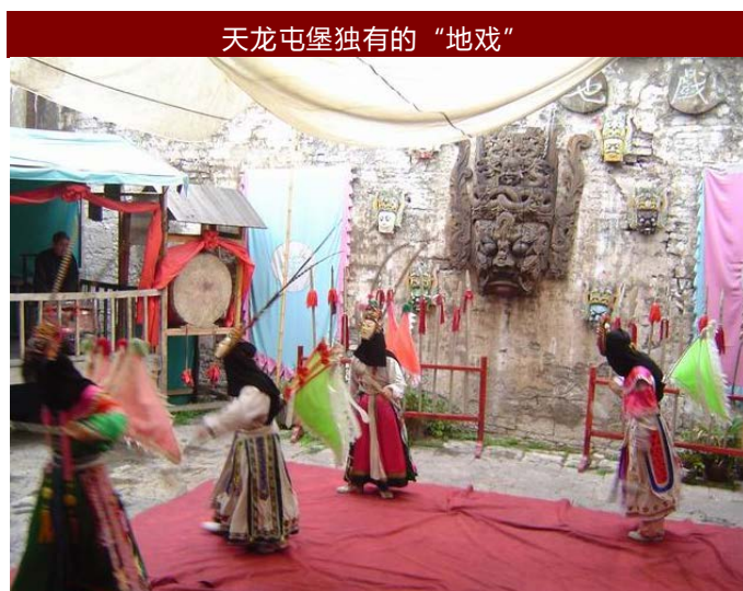
天龙屯堡独有的“地戏”

②每天早上 10:30 分，在贵阳金阳汽车站乘贵阳——杨武的汽车，在天龙镇下车。回程：在天龙镇乘下午 14:30 分的汽车，天龙镇——贵阳。票价：21 元。