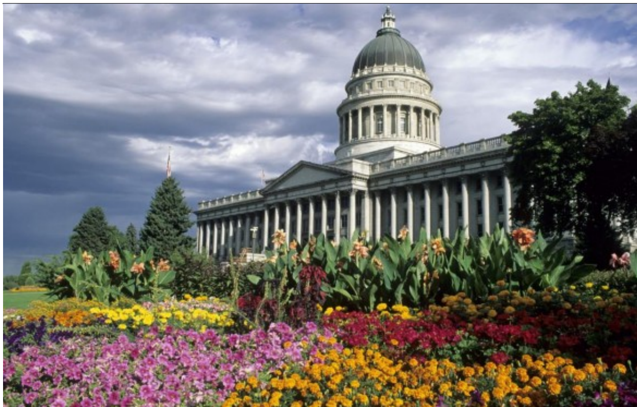
图为犹他州州议会大厦

参观犹他州州议会大厦是来盐湖城度假四季皆宜的一个休闲之地。犹他州州议会大厦是美国各个州政府大楼中比较气派的一个，不同与其他大多数州议会大厦，犹他州州议会大厦是座落在盐湖城边的山坡上。参加每小时一次的当地导游，你将了解很多你绝不会想到东西：比如设在州长办公室的“龙卷风办公桌”背后的故事。在完成参观的同时孩子们还可以参加国会宾果寻宝比赛，一旦他们找到了在事先发给他们的纸上所列的所有东西，在参观结束时他们可以得到一个奖品。中午时分，穿过国会大厦东侧停车场边上的小径可来到树丛公园，在这里享用午饭。坐落在山坡上的州议会大厦，是一座典雅的建筑杰作。参观完内部的历史故事和豪华，荡漾在室外超过40亩建设与维护极好的精美雕刻，草坪，树木，花坛。远眺瓦萨奇和Oquirrh山的壮丽景色，俯瞰盐湖城市区都会使你的州议会大厦之旅平添多重享受和记忆。早些时候在草坪上的免费电影更会给你的州议会大厦之旅画上完美的句号。