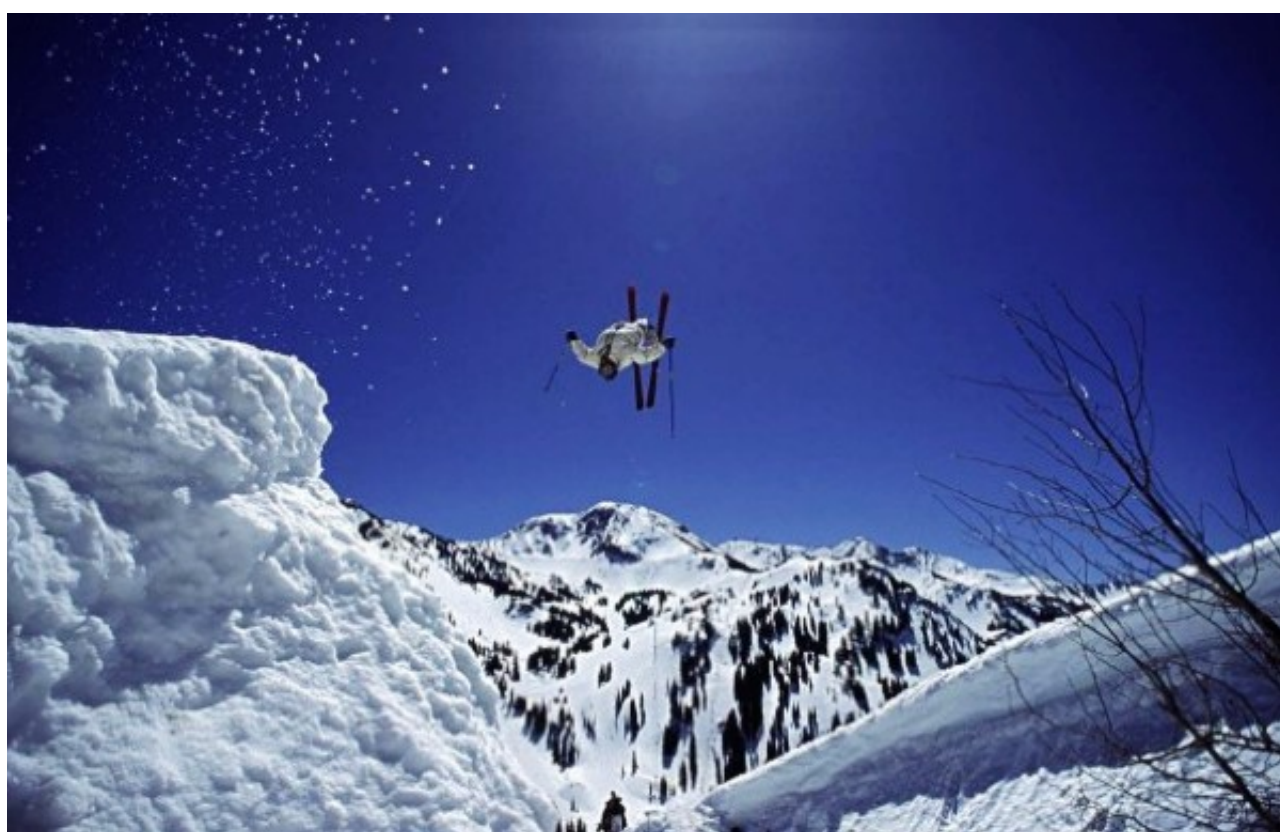
在盐湖城可以看到世界上最好的雪

众所周知盐湖城是世界著名的滑雪圣地。可当你冬季来到盐湖城看到机场大厅醒目的标语“地球上最好的雪(the best snow on earth)”，你可能还是会暗自思讨“是否过度自夸了？”。然而一旦你踏上任何一条滑雪道，你的疑问一定会随着你的感叹“真不愧是地球上最好的雪”而烟消云散。所以无论你是经验丰富的滑雪通还是对滑雪一窍不通的初学者，无论你是独行者还是拖儿带女的家庭游都不要给自己留下“错过触摸和享受地球上最好的雪”的遗憾。滑雪场很大，和美国其他滑雪地一样，滑雪道根据难易程度分为黑，蓝，绿三种雪道，很过瘾。冬天的雪山雪场为当地