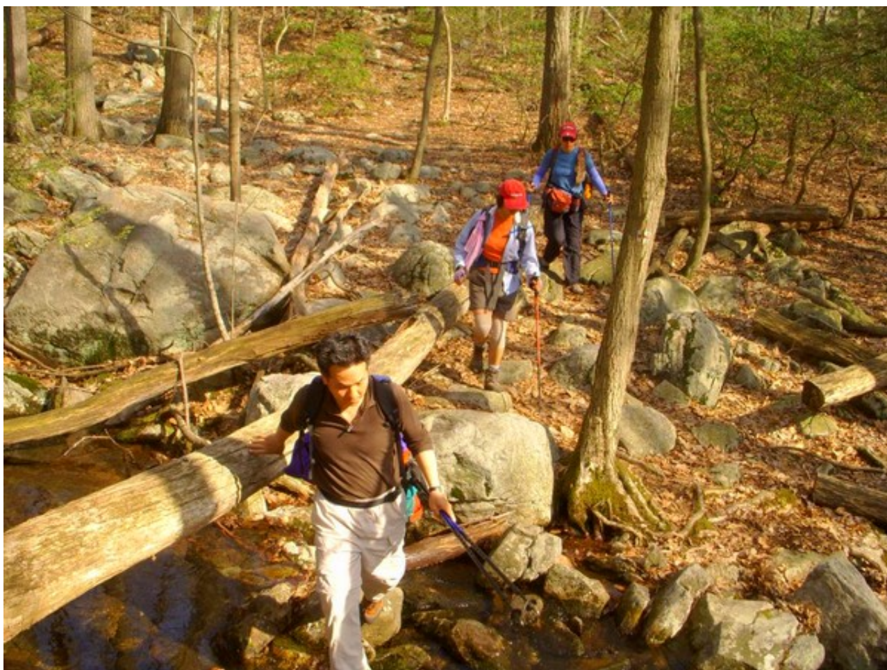
图为这是地方州立公园

在山麓大道东侧可以步行到遥远的过去--这是地方州立公园(This Is The Place State Park)。旧犹他州是一个活的古村落，再现1847年和1869年之间的一个典型的社会。目睹先驱们日常生活的风景名胜，并参观土坯房，商店，学校，教堂和文化活动场所。