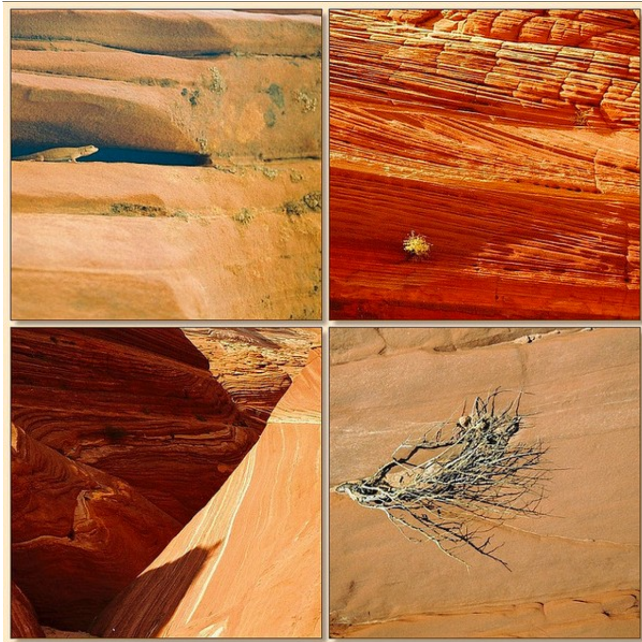
图为荒野保护区

在犹他州卡纳布(Kanab)以东约45英里座落着壮观的帕里亚峡谷/朱红悬崖(Paria Canyon/Vermilion Cliffs)荒野保护区。荒野地区包括112000亩红岩峡谷和逆断层山区。