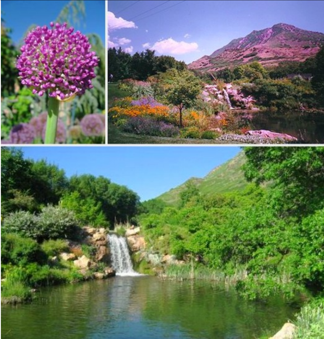
图为红色小山花园

红色小山坐落在山麓大道东侧的山脚下。从这里可以看到令人惊叹的盐湖谷全景。该花园拥有150亩的自然区域，蔚为壮观的花卉，喷泉，瀑布和散步小径。还有特别设置的儿童主题公园。