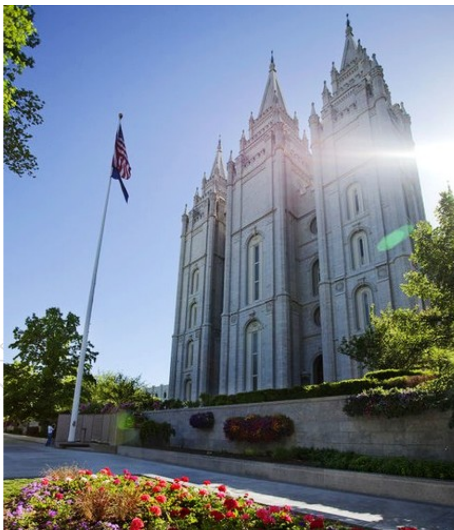
图为雄伟的圣殿广场

盐湖城的圣殿广场(Temple Square)是犹他州的最受欢迎的旅游目的地。没有参观圣殿广场就不能