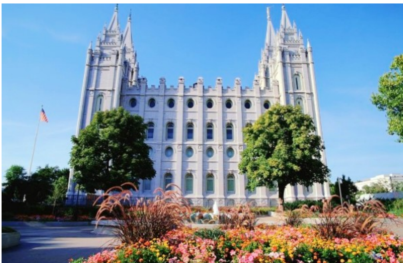
图为盐湖城的圣殿广场

盐湖城的圣殿广场(Temple Square)是犹他州的最受欢迎的旅游目的地。这个占有盐湖城市中心的三个街区的广场包含近20个和摩门教先驱历史和族谱相关的景点。包括盐湖圣殿，会幕，和家庭历史图书馆。这意味著，游客可以看到全部或大部分景点在一个相对较短的时间内。请注意，在盐湖城闹市区的停车位有限，可能比较贵。游客应考虑公共交通作为替。犹他州交通管理局经营的多条巴士路线和轻轨都在广场一带有车站。