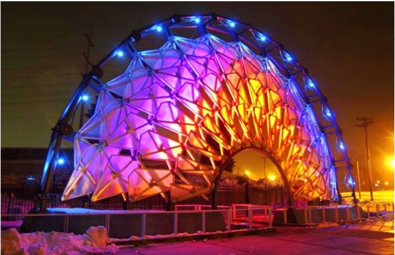
图为奥运会神魔公园

奥运会神魔公园是2002年盐湖城奥林匹克的精神之所在。它毗邻水稻埃克尔斯体育场，是开幕式和闭幕式现场。公园立着醒目的大釜和Hoberman拱门，还有游客中心，和一个剧院。展示面板诉说着这届奥运会的17天的故事。在美国犹他州大学乘TRAX可到达。