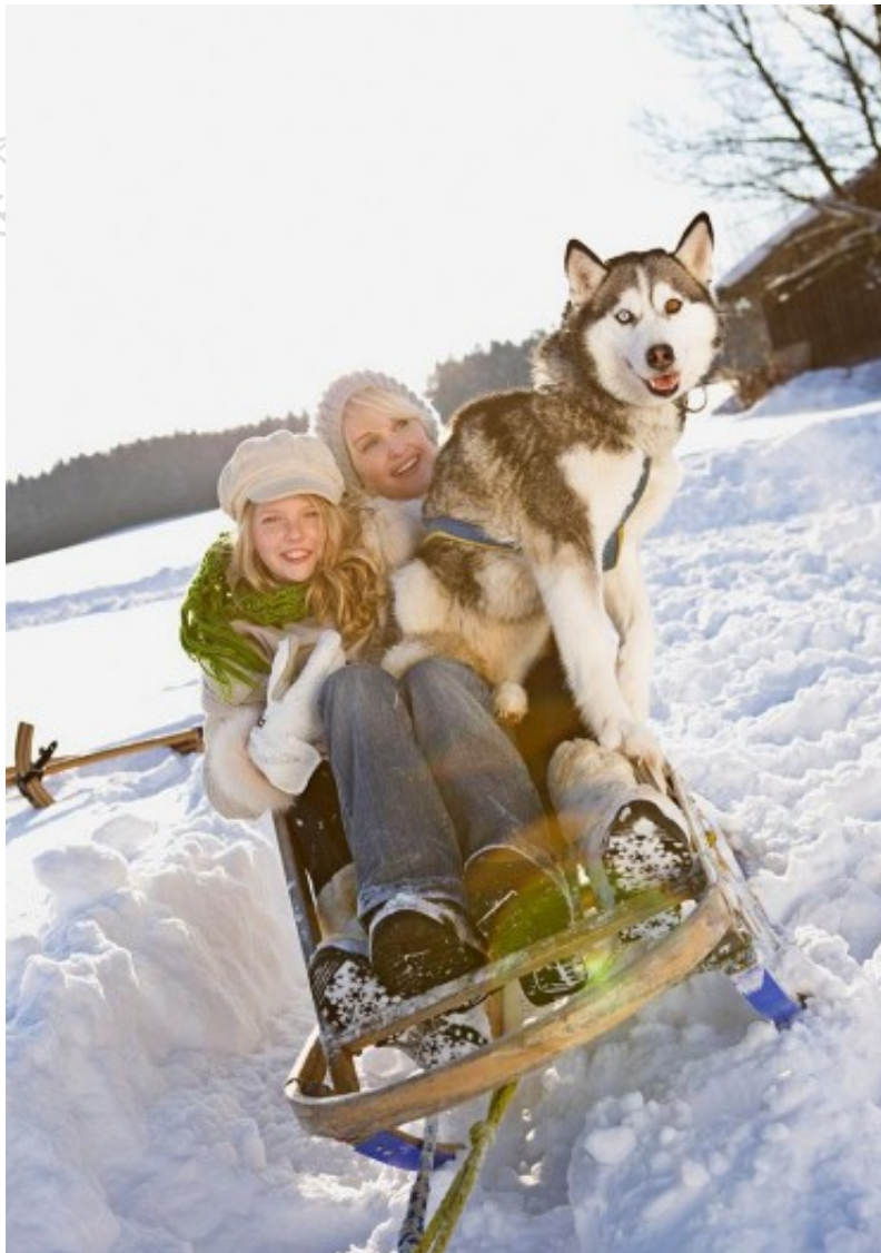
狗拉雪橇是一个惊人的户外探险体验

你想尝试新的东西，要找一个惊人的玩儿的尽兴的户外探险吗？你是否向往在人际罕至的茫茫雪原中尽情奔驰？狗拉雪橇正是这种探险，并迅速成为最流行的冬季户外运动之一！在盐湖城附近有几个半山寨版的林海雪原可以了却你的夙愿。当你坐在一个令人兴奋的狗拉的雪橇上，寂寂的林海中只有阿拉斯加犬的奔跑欢叫和把式的不断吆喝，橇速如梭，颠簸如同坐过山车，在你倍感刺激畅快的同时，你也一定会相信你将会带着持续一生的美好回忆，恋恋不舍地离开这些健壮勇敢友好的雪地犬和半山寨版的林海雪原！