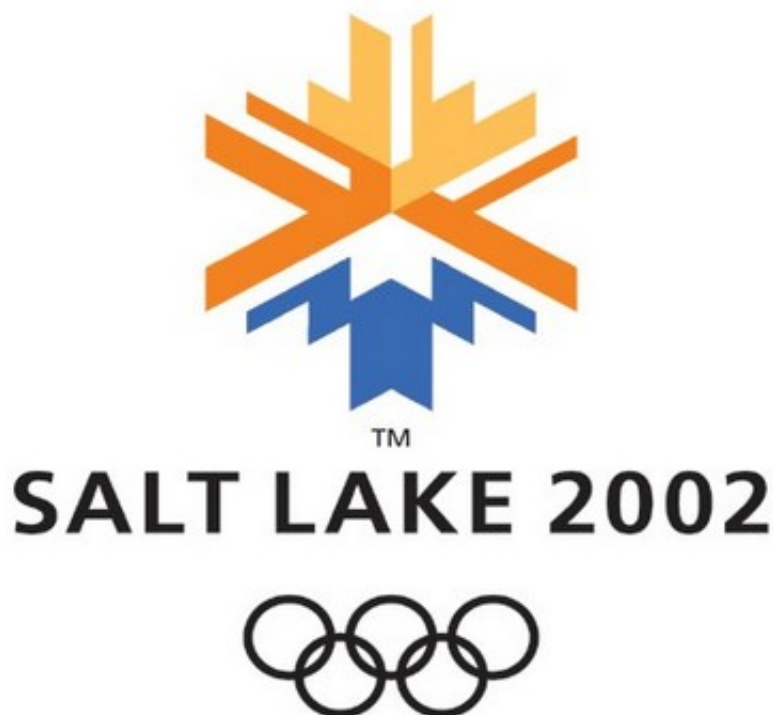
图为第十九届冬季奥林匹克运动会会标

2002.2.8-24日，第十九届冬季奥林匹克运动会在盐湖城召开，共有来自77个国家和地区的共2399名运动员参加了本届盛会(其中女运动员886名，男运动员1513名)，夺取金牌的选手来自多达18个代表团，创造了历史最高纪录。本届冬奥会的设项增加到7个大项15个分项78个小项，新增加的两个项目是有舵雪橇和女子雪车两个大项目。其中有舵雪橇项目曾于1928年瑞士圣莫里茨奥运会上进行过比赛，分为男、女各一项比赛。而女子雪车则是首次进入奥运会，此次列入的是双人项目。