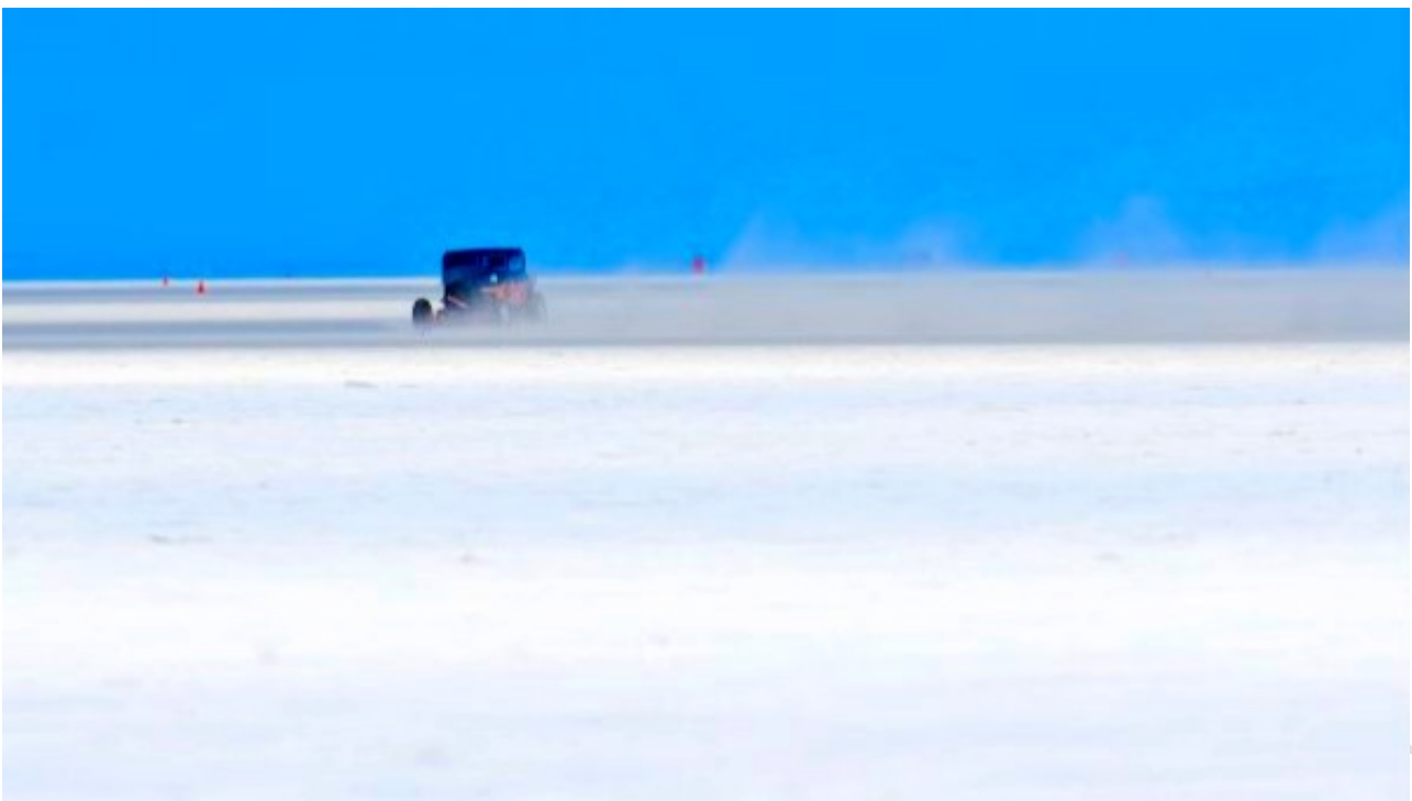
图为邦纳维尔盐滩

邦纳维尔盐滩位于犹他州西北部沿犹他州内华达州边界附近的I-80。温多弗(Wendover)是最近的城市。在这片绵延30,000英亩寸草不生的稠密沉淀的白色坚硬盐滩是犹他州的最独特的自然特征之一。由土地管理局管理的特别环境和游乐管理区。