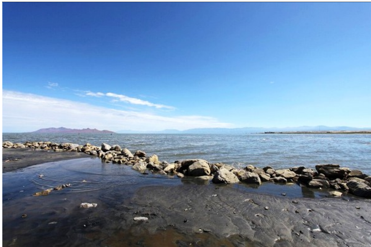
图为盐湖城州立滨海码头