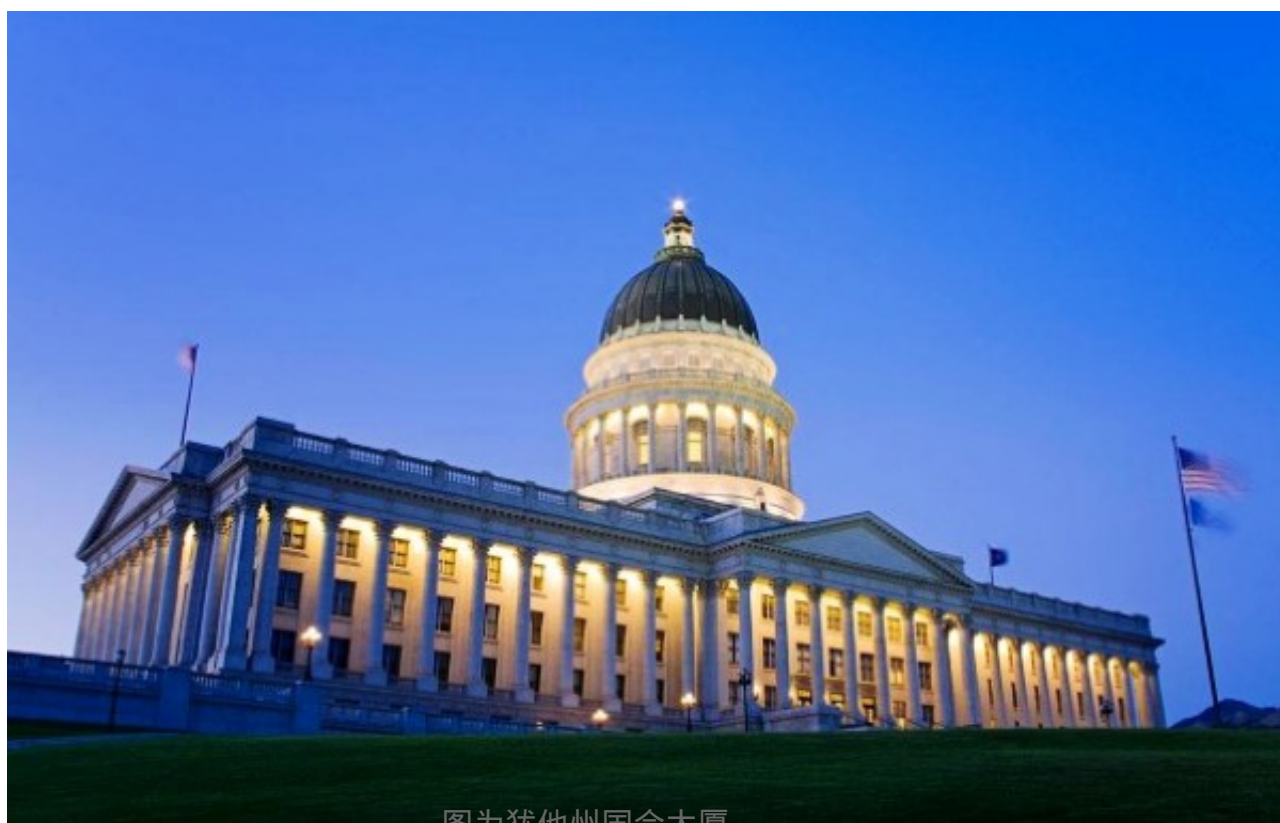
图为犹他州国会大厦

犹他州国会大厦在盐湖城是最受欢迎的旅游景点之一，原因是多方面的。州议会大厦在1915年完成，是一个文艺复兴风格的建筑。除建筑物本身的美之外，从其独特结构可看到瓦萨奇(Wasatch)和Oquirrh山，大盐湖和峡谷地等令人难以置信的美景。“盐湖城，一个惊人的景观”！