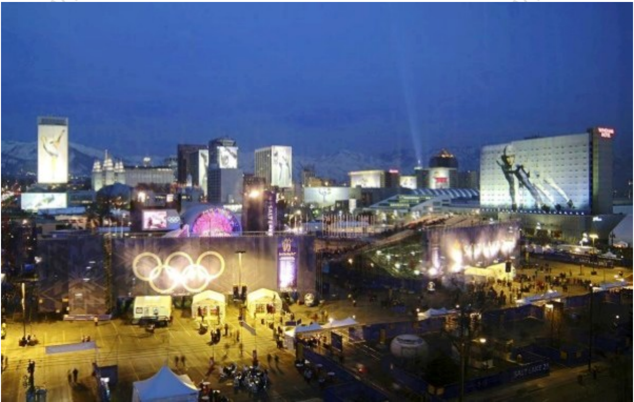
图为犹他奥林匹克公园

公园城(PARKCITY)附近的犹他奥林匹克公园是2002年冬季奥运会雪橇，雪橇和跳台滑雪比赛的现场。游客可以在导游的带领下参观公园和运动员的培训课程。公园还有70英里每小时的雪橇，zip line和快速银色高山幻灯片乘坐等游乐设施。奥林匹克博物馆是一个互动博物馆。周六有自由式空中和跳台滑雪表演。还有适合各种不同年龄人的宿营地。