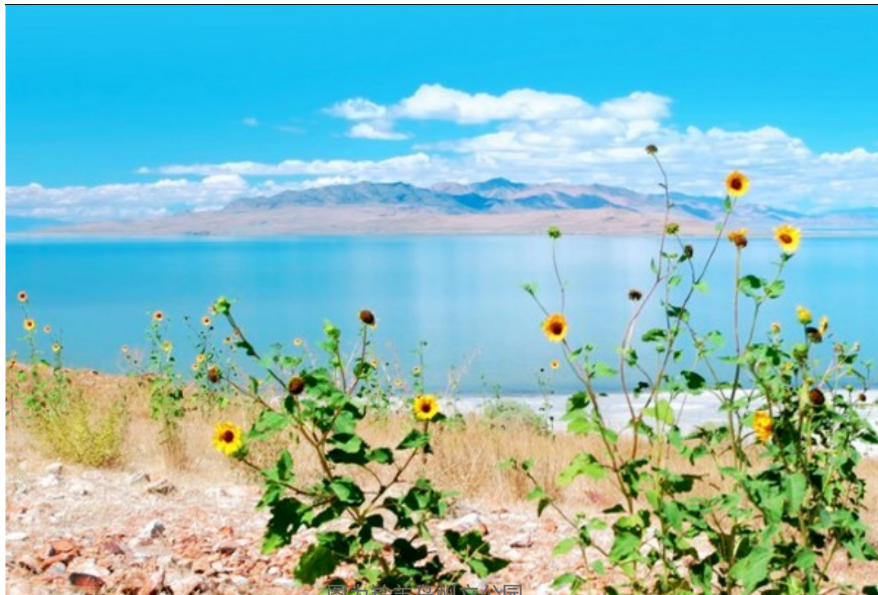
图为羚羊岛州立公园

绵延15英里的羚羊岛州立公园，位于盐湖城西北40英里处，有一流的沙滩，适合游泳和散步。这里还是美国最大的野牛群居地之一，秋天野牛被成群的赶进畜栏的场面甚是壮观。此外，公园内还有简易的露营区，全年都是开放的。