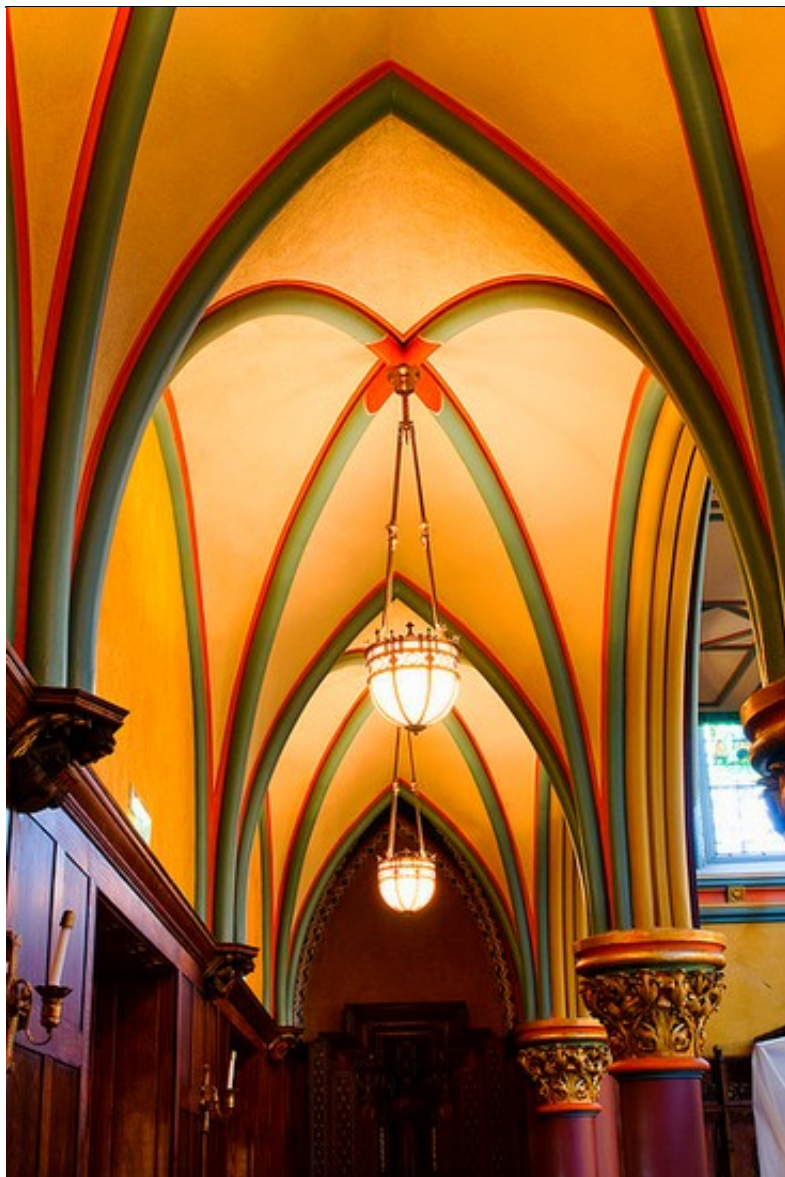
图为马德琳大教堂

马德琳大教堂是盐湖城最大的天主教教堂。它已恢复到原来的辉煌，并被称为一个文化的杰作。