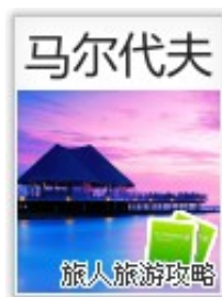
马尔代夫：花环群岛