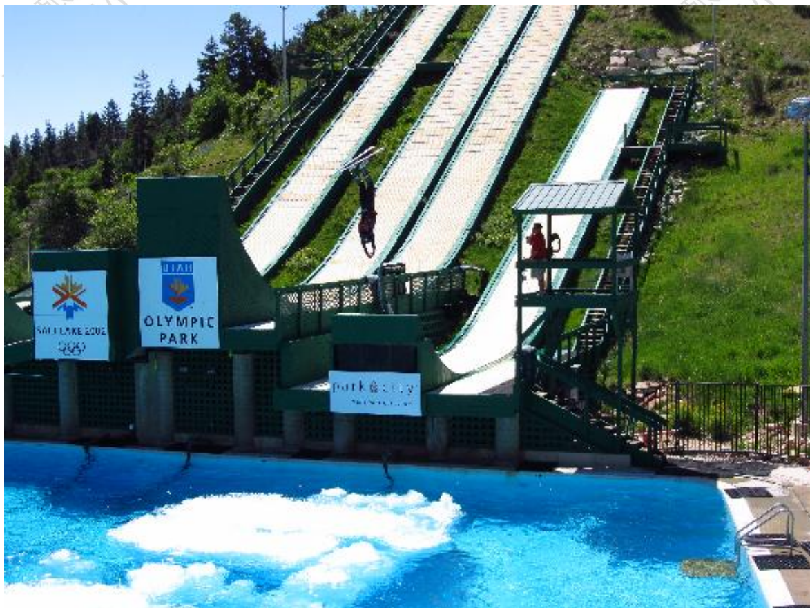
图为犹他奥林匹克公园内景

在犹他奥林匹克公园你可乘坐公园提供的游览车穿梭于不同区域和景点。奥林匹克公园不仅仅是参观奥运会的历史，也有不分年龄人人共享的游乐设施。在你体验了高山滑道，ziplining（一个快节奏和一个速度较慢）的乐趣后，如果你有强壮的心脏，那你切不可错过体验BOB雪橇(bobsledding)的惊险。BOB雪橇车里有一个驾驶员，所以你不用控制车辆，但请你相信，这是值得的，只是那坐享其成的G力和速度足以使你终身难忘。