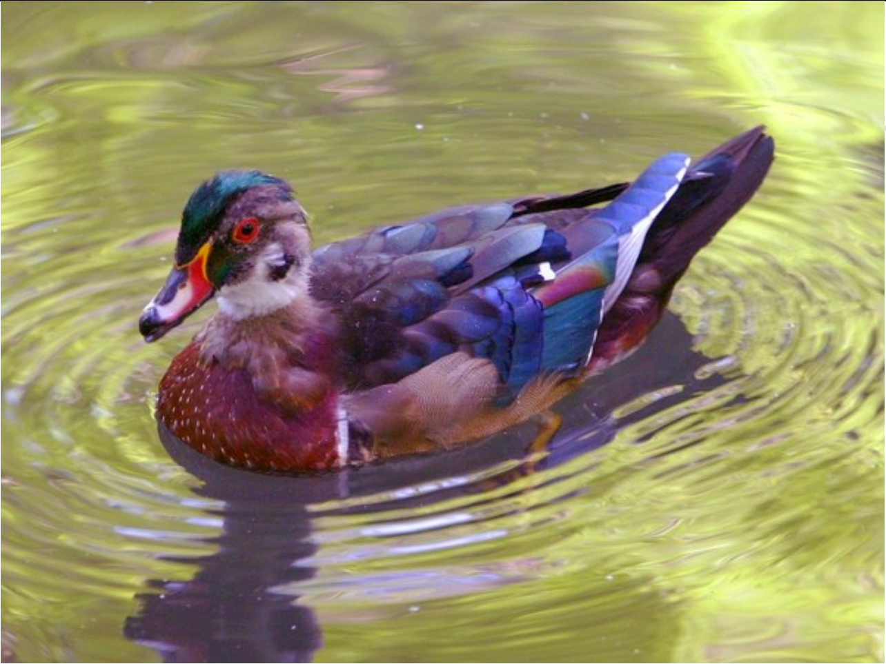
图为特雷西观鸟园

特雷西观鸟园坐落在自由公园的西南端，是美国历史最悠久，规模最大的鸟园。百鸟园目前保持约500多只鸟，代表150种鸟类。其中21个被列为濒危或受威胁鸟类。