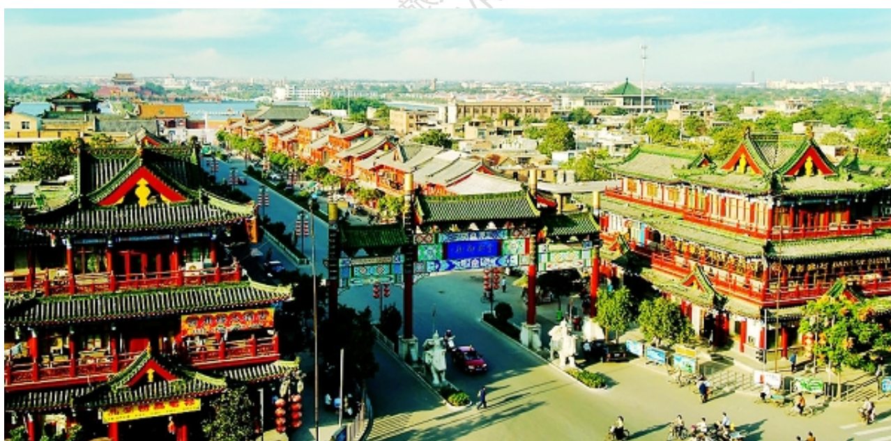
俯瞰宋都御街街景 (图片由网友 @左耳说历史 提供)

宋都御街位于开封市中山路北段，是为再现宋代御街风貌，于1988年建成的一条仿宋商业街。南起新街口，北至五朝门，全长400多米。两侧角楼对称而立，楼阁殿铺鳞次栉比，其匾额、楹联、幌子、字号均取自宋史记载，古色古香。50余家店铺各具特色，经营开封特产、传统商品、古玩字画。售货员身着仿宋古装，殷勤地招待八方来客。漫步御街，仿佛一步跨越了上千年的历史长河，令人充满对昔日宋都繁华景象的无限遐想。