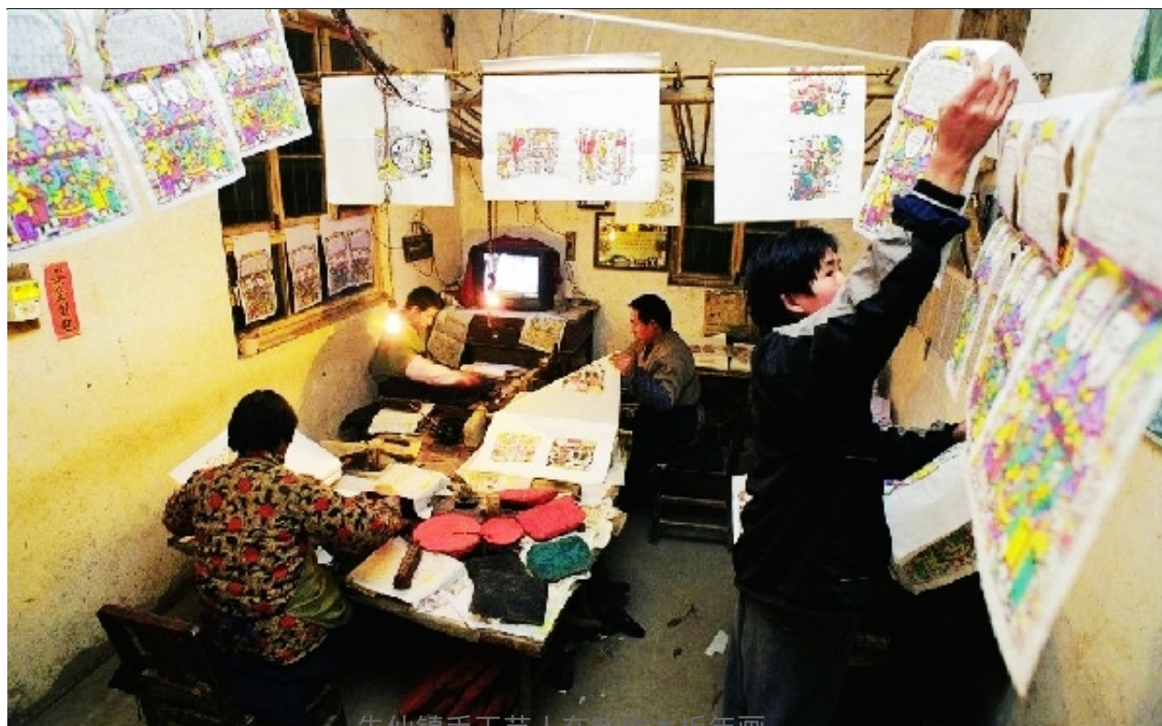
朱仙镇手工艺人在制作木板年画