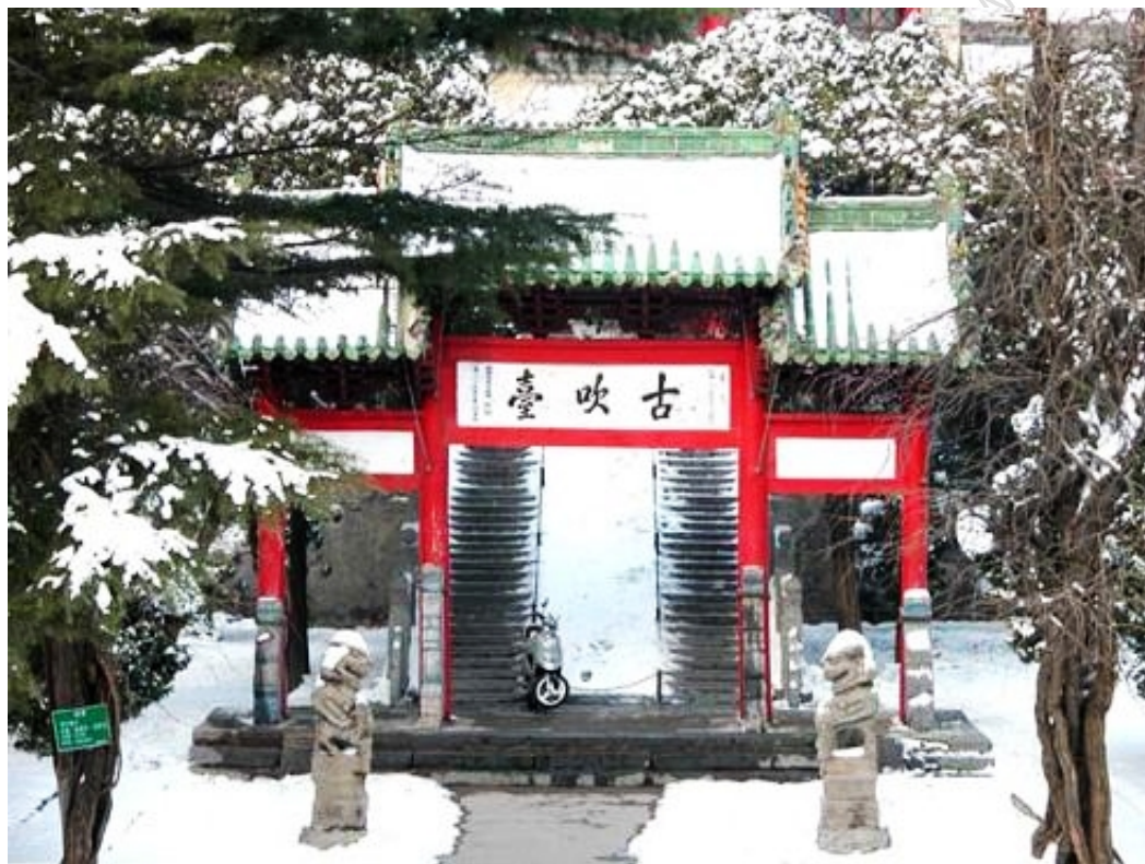
禹王台公园古吹台

禹王台最早叫吹台，相传春秋时代晋国著名盲人大音乐家师旷曾在此吹奏乐曲得名。现今禹王台公园内的主要景点有：纪念师旷的古吹台；康熙亲书“功存河洛”牌匾的御书楼和乾隆御碑亭；为纪念李白、杜甫、高适三位大诗人登吹台吟诗作画而建的“三贤祠”；纪念大禹治水的禹王殿等。除了文物古迹，公园内还有辛亥革命烈士纪念园、牡丹园、中日友好樱花园、芳春园等浏览景区。园内苍松翠柏，古树参天，奇树佳卉，花团锦簇，亭廊楼阁，风光旖旎，鸟语啁啾、景色宜人。登临其间，令人游目骋怀而心旷神怡，是名副其实的千古名园。