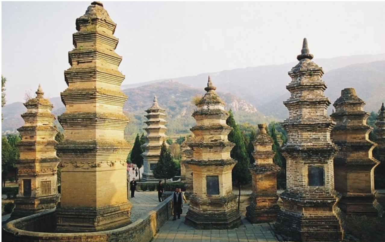
少林寺塔林

少林寺是我国久负盛名的佛教寺院，声誉显赫的禅宗祖庭，少林功夫的发祥地，位于登封市西12公里处的嵩山五乳峰下，是嵩山风景区的主要核心景区之一。民国时期，军阀石友三放火烧毁了少林寺的大部分建筑，千年基业毁于一旦。新中国成立后，少林寺雄风重振，特别是1982年一部《少林寺》电影，使少林寺、少林功夫风靡世界，成为河南乃至世界的一个顶级旅游产品。少林寺自建寺以来，禅、武、医举世闻名，经久不衰，沉积了丰厚的历史内涵和文化底蕴，曾先后被评为“郑州市十大旅游景区”、全国首批“4A级景区”，年接待游客150余万人次，是名副其实的中原旅游明珠，华夏旅游胜地。