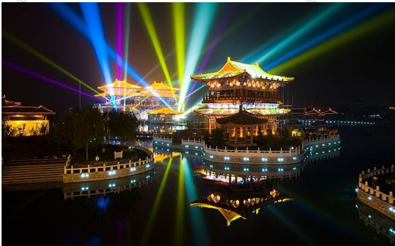
清明上河园夜景 (图片由网友 @东方的新视觉 提供)

《清明上河图》复原再现的大型宋代历史文化主题公园。主要建有城门楼、虹桥、汴河、食街、酒楼、茶肆、当铺等。集中展现民间游艺、杂耍、盘鼓、斗鸡等京都风情。整个景区内芳草如茵，古音萦绕，钟鼓阵阵，形成一派“丝柳欲拂面，鳞波映银帆，酒旗随风展，车轿绵如链”的栩栩如生的古风神韵。清明上河园作为集历史文化旅游、民俗风情旅游、休闲度假旅游、趣味娱乐旅游和生态环境旅游于一体的主题文化公园，突出体现了观赏性、知识性、娱乐性、参与性和情趣性等特点。