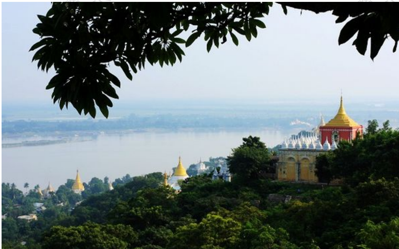
石皆山远眺伊诺瓦底江

从因瓦路口跨过Ava Bridge桥，就是点缀着佛塔的实皆山。实皆山上有佛塔、佛寺500多座，大约有6000名僧人在那里修行，佛像更是多得数不胜数。在西南侧山脚附近的Tilawkguru是一座岩洞式寺庙，建于1672年，内部有很多壁画。观看实皆山最美的时间和地点是清晨太阳出来之前在伊洛瓦底江中（估计江对岸也不错）。实皆山下的实皆村是一个大集市，可以考虑在此停留过夜以便第二天一早到江中或对岸欣赏实皆山。