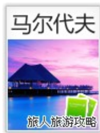
马尔代夫：花环群岛