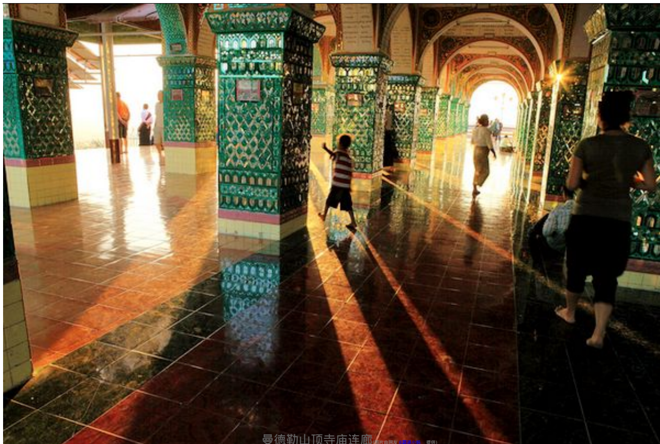
曼德勒山顶寺庙连廊 (图片由网友 (1362136) 提供)