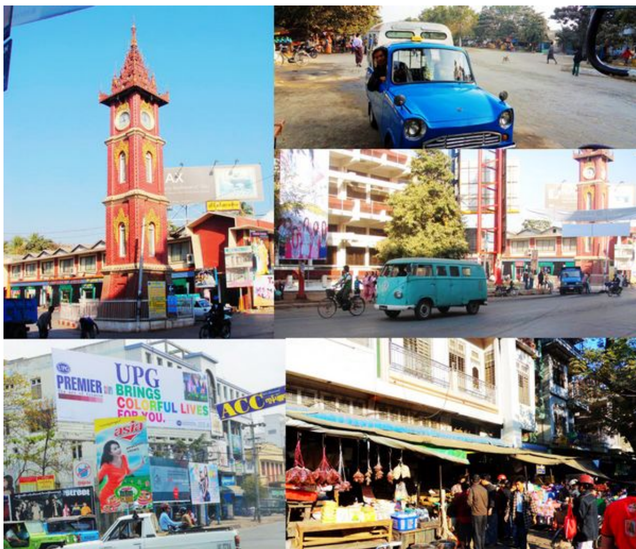
街头掠影

曼德勒的清晨和傍晚永远是缓慢的，商贩们不紧不慢地开门、洒水、喝茶，有没有生意不是什么