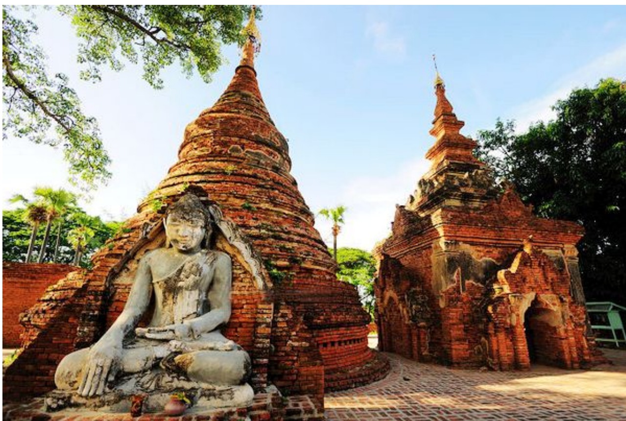
阿玛拉普拉

曼德勒是缅甸第二大城市，但大多数人感觉它是个缓慢陈旧的大县城，其精华所在是它的周边，那些散落四野如珍珠般的古城几百年来几乎没有变化，全部用珍贵柚木建造的超级长桥，隐没在热带丛林里的破败古寺，蛋糕裙一样的白色层塔，群山遍布的佛塔阵……一切似乎都和几百年前一样，沉睡的古迹至今没有醒来。曼德勒周边的主要的古城有4个，分别是：阿玛拉普拉（Amarapura）、因瓦（Inwa）、实皆（Sagaing）以及敏贡（Mingu）。或徒步、或骑行或乘马车，这里