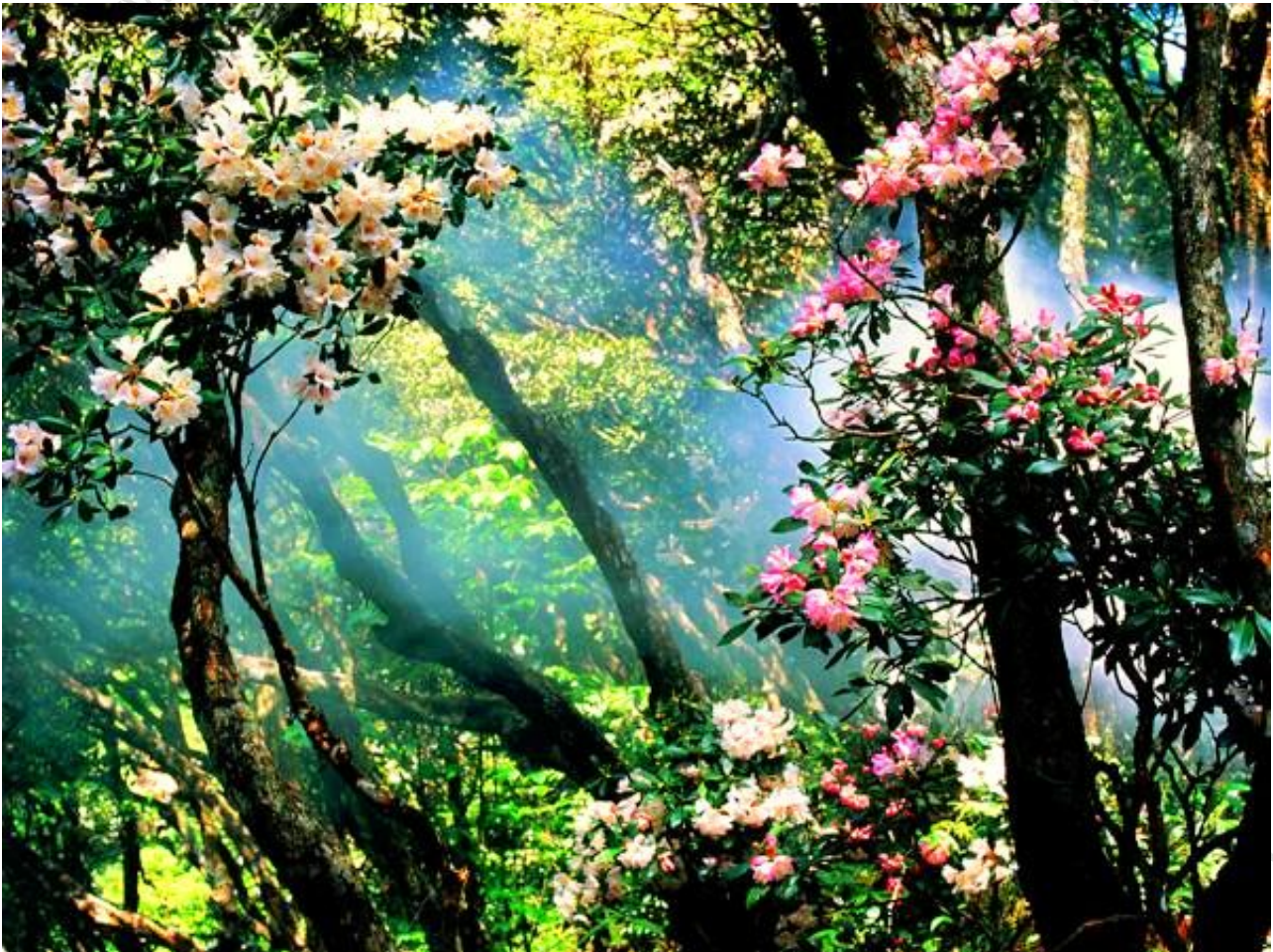
美丽杜鹃

一直以来，淳朴的井冈山人民对杜鹃花就有着一一种特殊的感情，那是因为井冈山的红杜鹃是用革命先烈的热血染红的。井冈山上的杜鹃花，承载着革命前辈的宏伟夙愿。