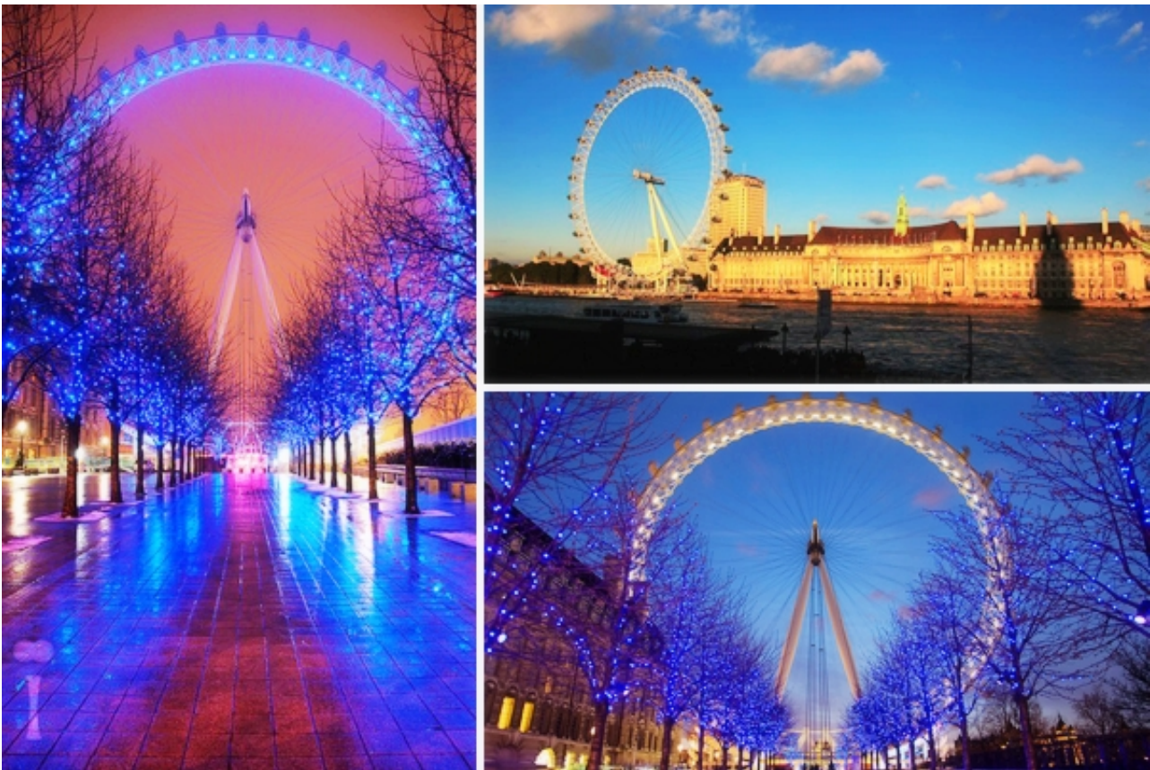
千禧之轮-伦敦眼

为了庆祝千禧年的到来，一座巨大的摩天轮矗立在了泰晤士河畔。在它诞生的1999年末，这曾经是世界上最早最大的观景摩天轮。作为庆祝千禧年时的一个疯狂想法，原计划只打算让它存在五年。可“ The London eye（伦敦眼）”一开放，便迅速成为整个伦敦最热门的旅游景点之一。