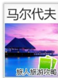
马尔代夫：花环群岛