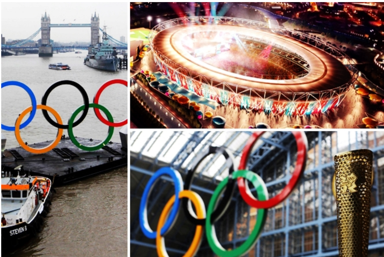
伦敦奥运