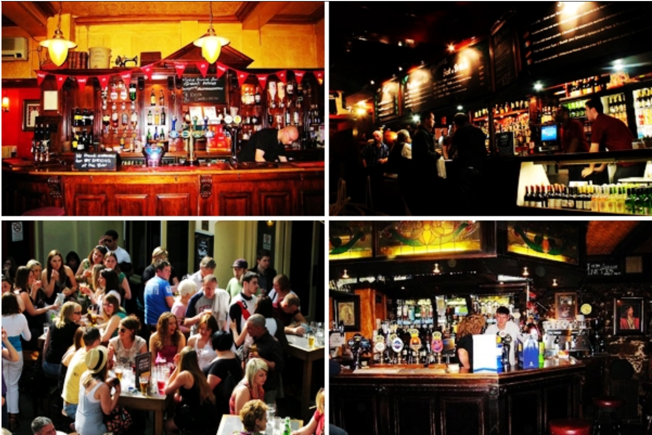
伦敦酒吧

有句话说，没有去过英国的酒吧，就不算到过英国。酒吧被认为最能反映英国文化的地方。Pub（酒吧）来源于public，是平日里拘谨严肃的英国人向陌生人敞开心扉互相交流的好去处。有的人买了酒后就找张桌子坐下来，还有的人仍然在吧台前徘徊。通常，后者就在等待聊天对象的表现。在这里，大家不需要知道对方的名字，但可以天南海北的交谈，也可以像老朋友一样互相请酒。夜晚的酒吧里，可以看到不一样的伦敦人，从他们的口中，当然有着同白天不一样的伦敦。