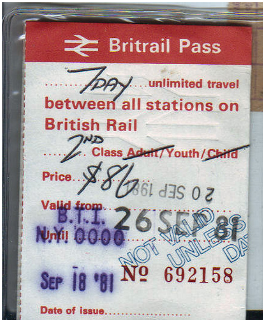
英国火车通票样本