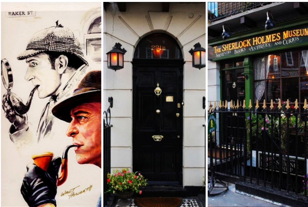
伦敦福尔摩斯的家

还记得那个头上戴着黑色礼帽、嘴里叼着烟斗、手持拐杖的大侦探吗？“贝克街221b”——就是福尔摩斯在伦敦的家，是所有侦探小说迷向往朝圣的地方，也是多年后的另一个被虚构出来人物——名侦探柯南，心心念念要来的地方。连以十九世纪福尔摩斯时代为背景的《贝克街的亡灵》，也一直被认为是最好看的柯南剧场版之一。然而福尔摩斯本来就是柯南道尔小说中的人物，他的家当然也并不存在。1990年，贝克街239号被伦敦政府硬生生地挂上了“221b”的门牌号码，