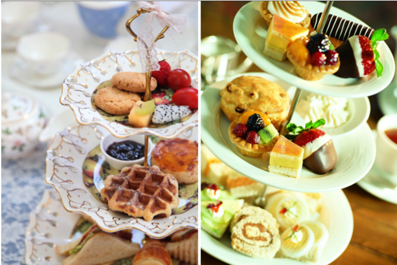
英式下午茶

一说到下午茶，眼前就是精致的瓷杯，慵懒的小桌和藤椅，还有树叶间投下的点点阳光，或许再添上一两个老友...如果“下午茶”前再加上“英国”两个字，画面就好像又温暖柔和了几分。对于大部分来伦敦玩的同学来说，时间紧任务重。但如果不拨出一个下午，哪怕只有两个小时，忙里偷闲去好好享受一次真真正正的英式下午茶，总不免觉得辜负了大好时光。这时候，味道不再是下午茶的全部。阳光下的浅蓝的天空，晴朗得几乎要滴出水来，羽毛般淡淡的云伸着懒腰舒展得躺在上面，间或有小鸟飞过，像路过的行人一样，不知道要去到哪里。不久之后，或许你也会和他们一样匆匆而过。但此时此刻，你在这儿，时间也在这儿。