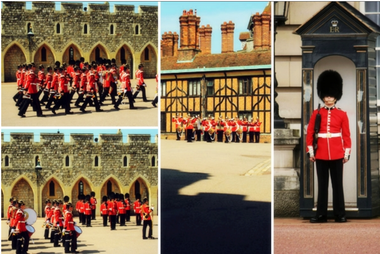
英国女王皇家卫队换岗仪式(图片由网友 ... 提供)

伦敦没有巴黎的浪漫，没有巴塞罗那的热情奔放，没有纽约的喧嚣与骚动，也没有威尼斯的水乡情调，她没有什么极端的特点，有的只是和谐与宁静中的一种文化氛围。也许是因为常年伴着比较保守的英国王室，伦敦很多景点都与王室有关：伦敦最杰出的哥特式建筑威斯敏斯特教堂，历代国王在此加冕登基、举行婚礼、举行葬礼；曾经血雨腥风的伦敦塔，今日英国人心中的“故宫”，每当夕阳西下，最后一线余晖照耀在伦敦塔上时，卫兵们那“上帝保佑伊丽莎白女王！”的声音，隆重气派又古典传统；旧时国王的猎鹿场海德公园今日依旧有激昂亢奋的演讲者；庄严华丽的圣保罗大教堂曾经默默注视过举世瞩目的世纪婚礼；女王会经过议会大厦的皇家回廊；抬头仰望，当看到白金汉宫正上方飘扬著英国皇帝旗帜时，女王仍在宫中，你与她的直线距离倏地就是这么近！