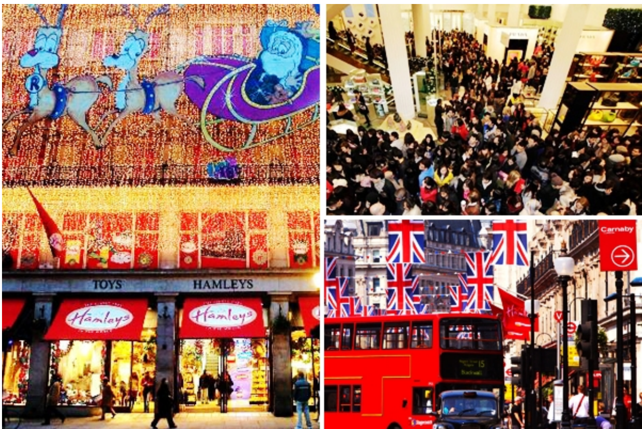
伦敦购物

如果你在大名鼎鼎的伦敦打折季来到这里，各大名品店的汹涌人流外加众多亚洲面孔，一定会带给你“宾至如归”的感觉，仿佛时空错乱回到国内。更加错乱的还有这里的价格。不知道伦敦是不是打折打得最凶的“名品集散地”，但对想拥有奢侈品的人们来说，这里绝对是“花小钱办大事”的好地方。平时那些“可远观而不可亵玩”的奢侈品，价格常常会低得让人油然而生一