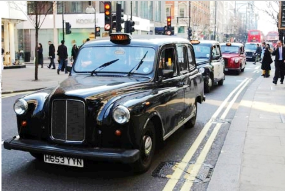
伦敦特有出租车—Black Cab

如果出租车的橙色空车标志亮着，表明可以拦车。一旦它停下来，7英里范围内的目的地，出租车司机是不可拒载的。伦敦很少有空车出租车，所以记住24小时叫车电话是非常有必要的。一