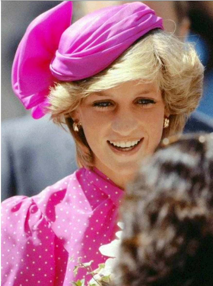
永远的戴安娜王妃