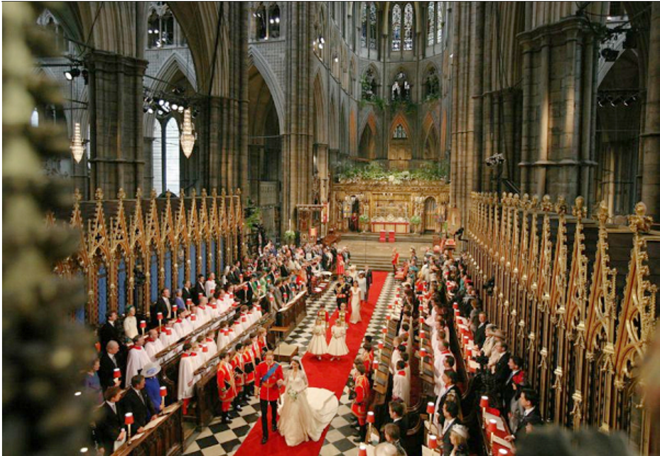
威廉大婚举办地：威斯敏斯特大教堂