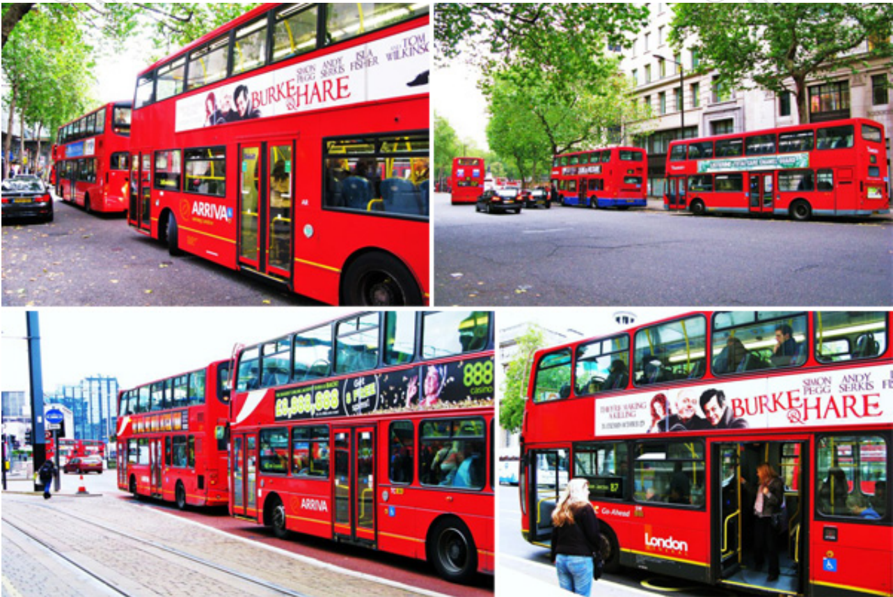
红色双层巴士

费用：使用牡蛎卡每次乘车只需支付1英镑，每天最高支付3英镑（不论乘坐多少次巴士）。现金单程车票则需要2英镑，16岁以下免费。一日游的通票为3.5英镑。