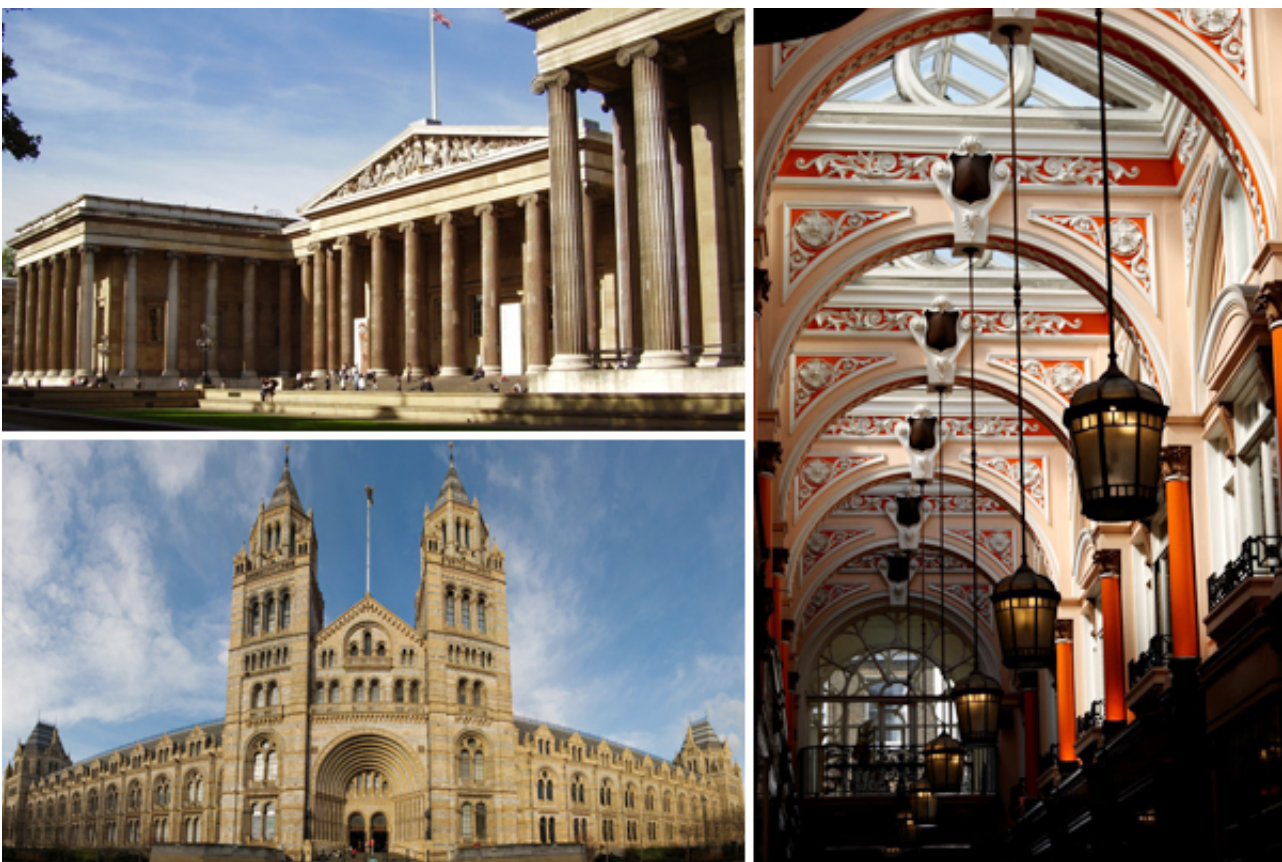
世界博物馆之都——伦敦

伦敦城市的分量，大概是由文化堆积起来的，各种各样的博物馆，便是一例。伦敦一直享有“世界博物馆之都”的美誉。