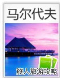
马尔代夫：花环群岛