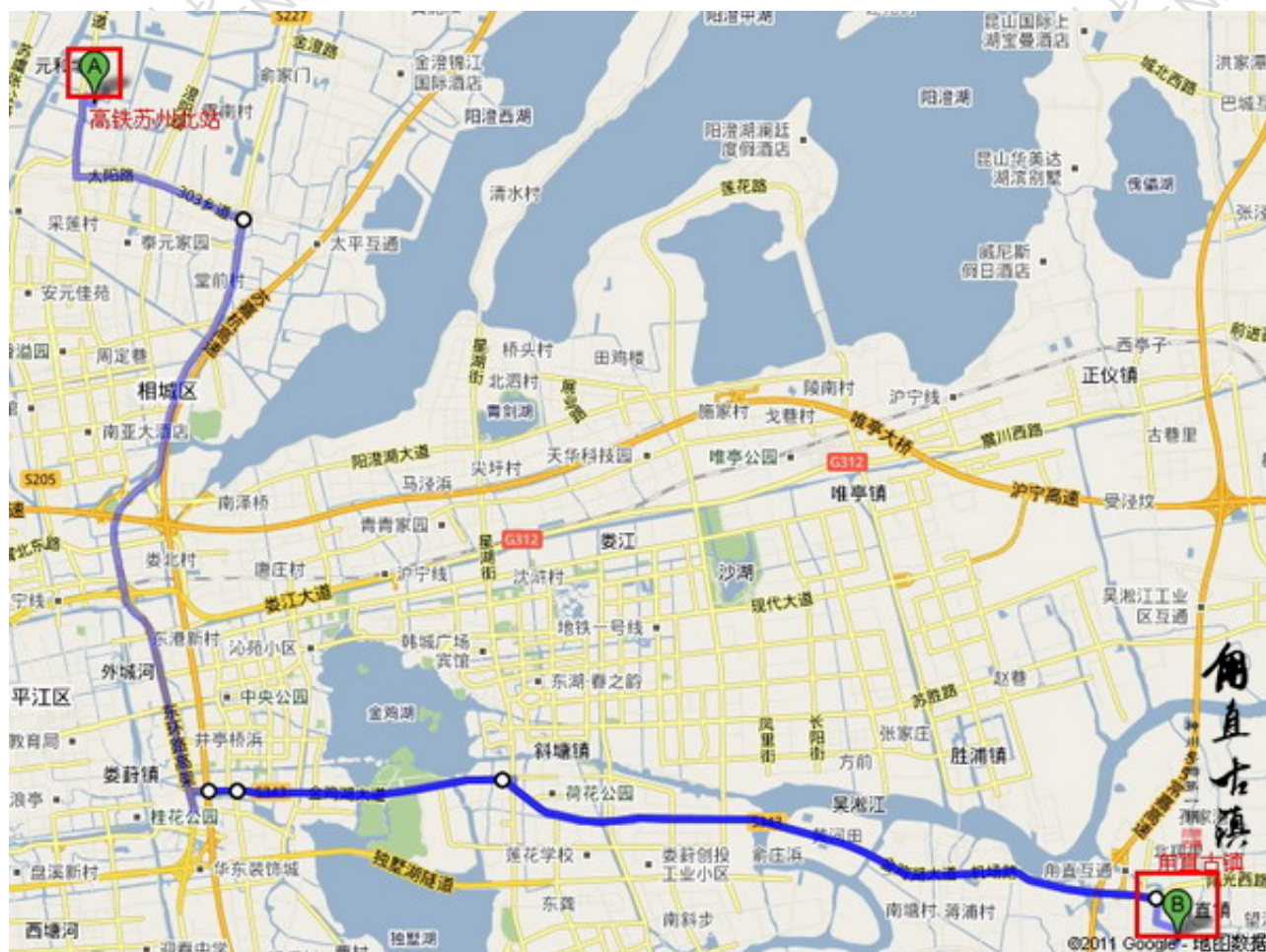
苏州北站—用直古镇