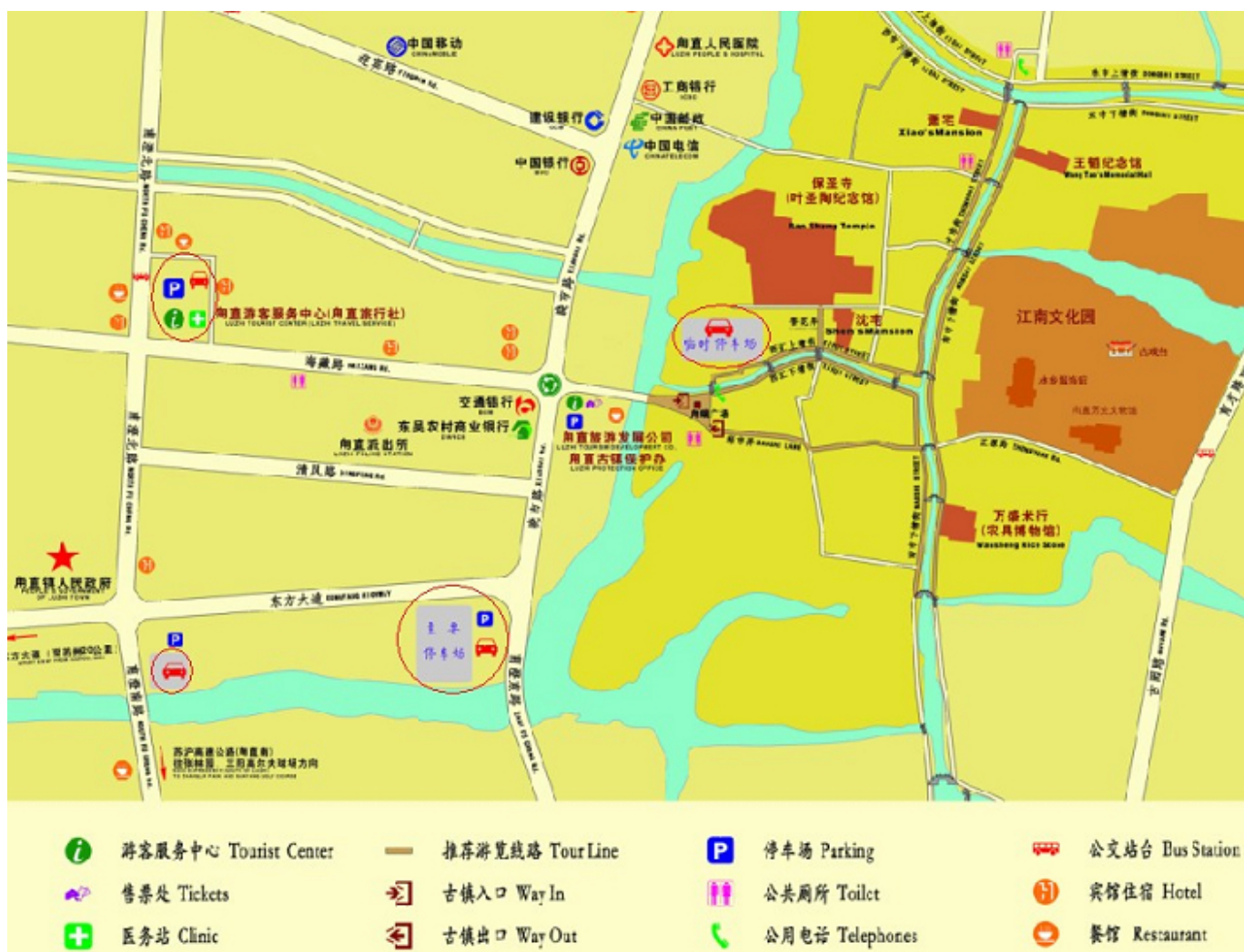
甪直景区停车示意图