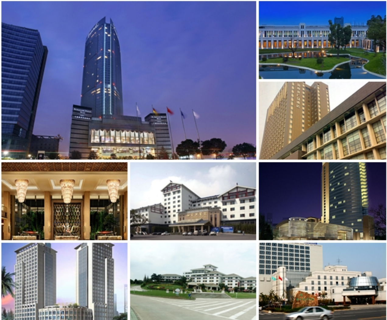
无锡酒店

无锡是个旅游城市，酒店和旅馆非常多。宾馆的普通标间在300-400左右，经济实惠的招待所也随处可见，如果没有事先预定酒店可到人民东路看看。