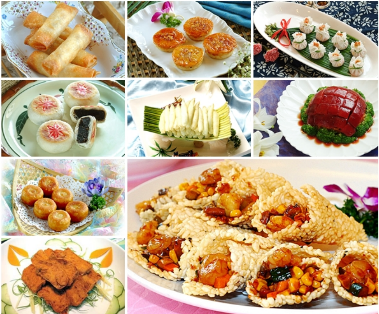
无锡美食