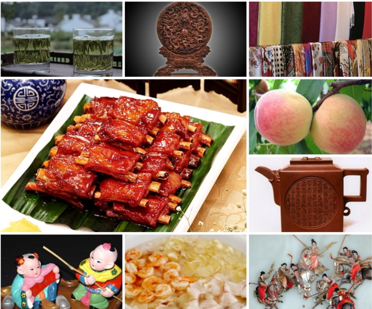
无锡特产