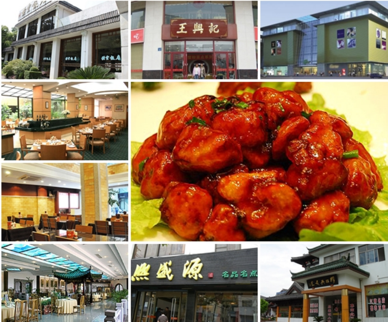
无锡特色餐馆