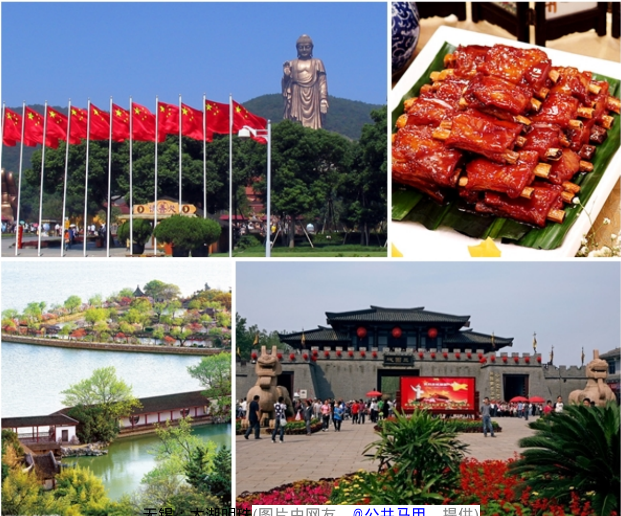
无锡：太湖明珠

“太湖明珠”无锡，江苏省南部的一个地级市，位于长江三角洲平原腹地，太湖流域的交通中枢，北倚长江，南濒太湖，东接苏州，西连常州，京杭大运河从中穿过。无锡自古就是中国著名的鱼米之乡、中国四大米市之一，同时也是一座繁华的现代化城市，中国民族工业的发源地之一，素有布码头、钱码头、小上海之称。无锡地处太湖之滨，风景绝美秀丽，历史千年悠长，是在江南蒙蒙烟雨中孕育出的一颗璀璨的太湖明珠，具有丰富而优越的自然风光和厚重而悠长的历史文化。