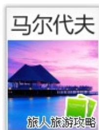
马尔代夫：花环群岛