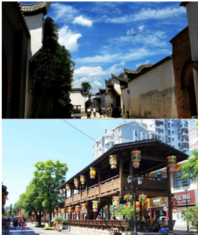
（图片由一起游网友@老鼠皇帝首席村妇提供）