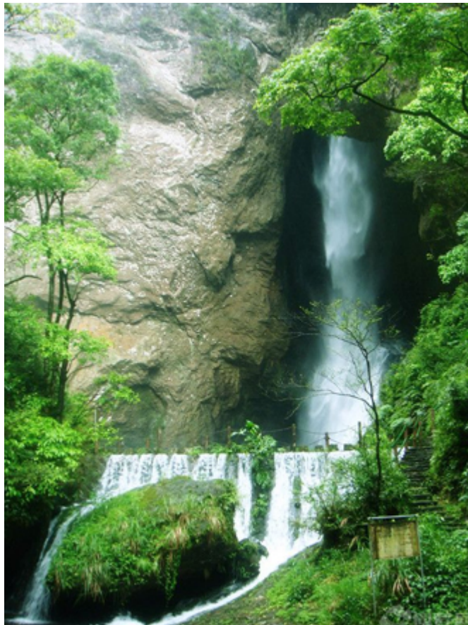
（图片由一起游网友@叶清凝提供）